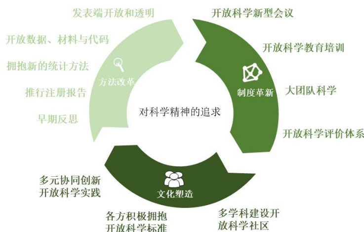
图 2 心理与脑科学开放科学的草根路径